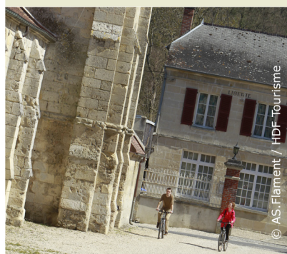
Au pied de l'église de Vorges