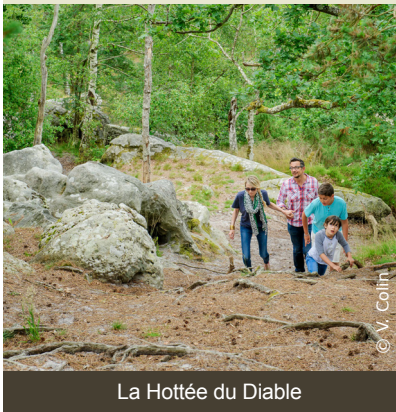
La Hottée du Diable