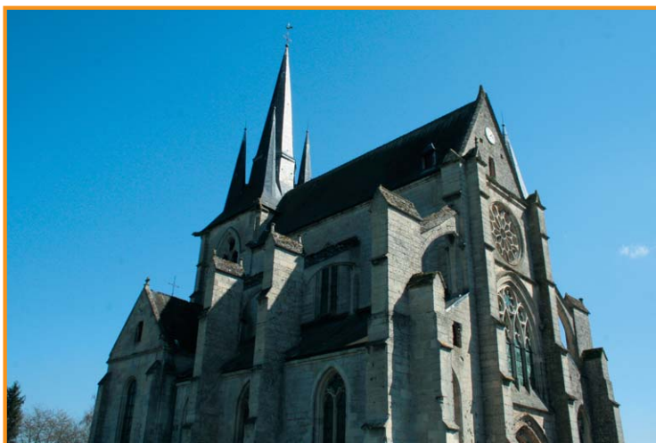
Vue sur l'église de Royaucourt. -OT Laon-

6 Prendre à droite la sente de derrière les fours et continuer jusqu'à la place des Frères Le Nain (D).