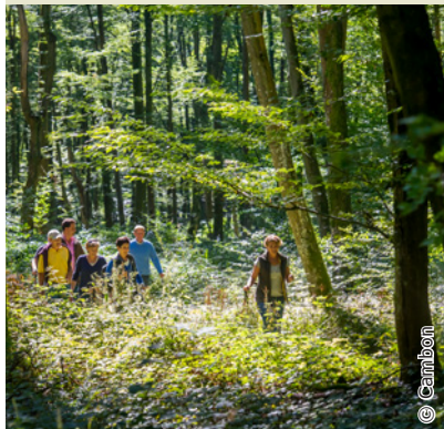
Randonnée en Forêt de Retz