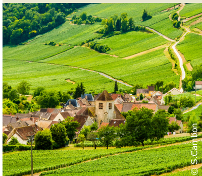
Le vignoble aux abords de Bonneil