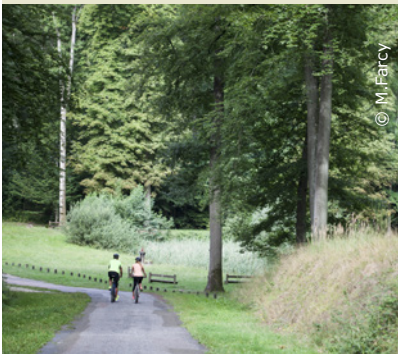
A vélo dans la forêt de Retz

INFOS TOURISTIQUES : Office de Tourisme Retz-en-Valois Tél. 03 23 96 55 10