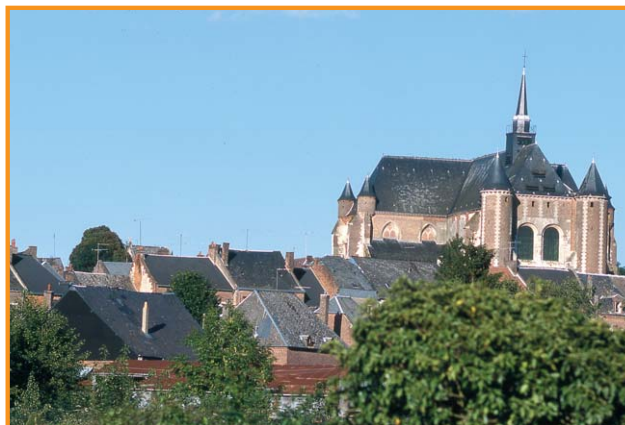
Village de Montcornet. - Anne-Sophie Flament-

D Faire le tour de l'église pour découvrir les échauguettes ajoutées à l'édifice gothique au XVIII e siècle ; une bretèche en brique a également été construite sur le chevet. Puis revenir devant le portail central. Là, s'amuser à déchiffrer l'inscription du linteau du portail : « En tout édifice antique faut l'accord comme à la musique ». Suivre la rue Pétrout en direction de l'hôtel de ville. Admiration la place centrale et l'hôtel de ville,