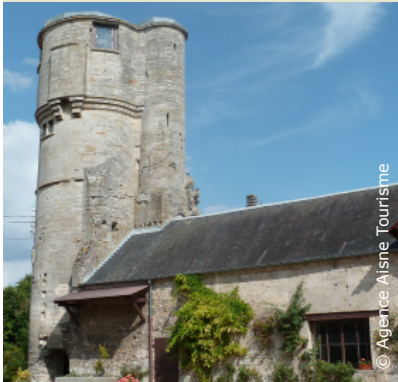
Vestiges du château médiéval