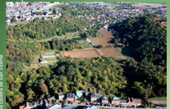
la caldera de San Vicente

5 "Petit" Saint-Vincent Un santuario que pertenecía a la abadía de San Vicente, ubicado fuera de las murallas de la ciudad. Era utilizado para hospedar peregrinos y también como refugio para clérigos cuando había invasiones.