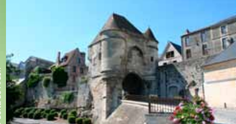
Puerta de Ardon

6 Puerta de Chenizelles Esta puerta medieval del siglo XII conduce a la "cuve Saint-Vincent", donde solía haber viñedos que producían vinos tales como el "Clos Saint-Rémy" y la "Goutte d'Or", ambos utilizados durante las ceremonias de coronación de los reyes de Francia, en Reims.