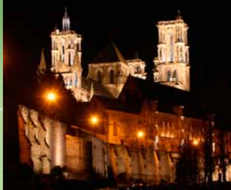
Catedral de Notre-Dame de Laón

11 Patio de Dauphin Este patio solía pertenecer a un hostel/albergue, y se dice que fue allí donde Luis XIV fue concebido, en un año de 1638 en la que Luis XIII y Ana de Austria se hospedaron durante su regreso de un peregrinaje a Liesse, donde habían estado rezando por un heredero.