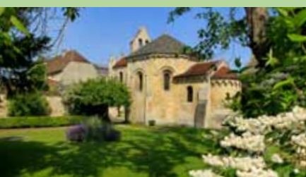
Capilla de los Templarios

15 Capilla de los Templarios En el antiguo centro de encomienda de la Orden, está ahora la capilla de los Templarios, construida alrededor de 1140 con el mismo diseño del Santo Sepulcro en Jerusalén. El museo tiene una vasta colección que incluye una pintura del siglo XVII de los hermanos Le Nain (originarios de Laón) llamada "El concierto".