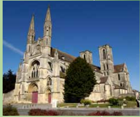
Abadía de San Martín

1 Abadía de San Martín Esta vasta abadía del siglo XII, segunda en el Orden Premostratense, fue fundada por San Norberto en 1120. Su arquitectura muestra una marcada influencia Cisterciense. Construida en ladrillo y piedra, esta vivienda incluye un elegante quiosco recreativo llamado "Vide Bouteilles". Adosado a la iglesia de la abadía, el claustro, que data del siglo XVIII, une la sala capitular, el refectorio y una imponente escalera, verdadera proeza de equilibrio. Hoy en día estos edificios alojan la inmensa colección de libros de la ciudad de Laón, incluyendo manuscritos medievales que datan de los siglos VII al XV, e incunables.