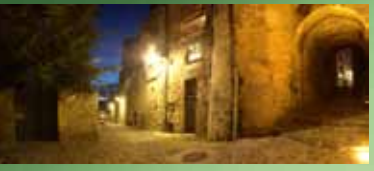
Puerta de Chenizelles

5 "Petit" Saint-Vincent Un santuario que pertenecía a la abadía de San Vicente, ubicado fuera de las murallas de la ciudad. Era utilizado para hospedar peregrinos y también como refugio para clérigos cuando había invasiones.