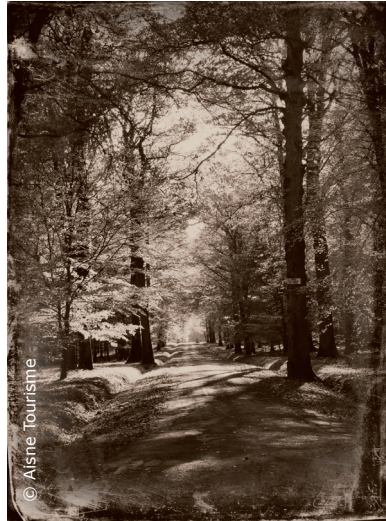
Promenade dans le Bois de Belleau

Le bois de Belleau, lieu de terribles affrontements, a joué un rôle capital dans le coup d'arrêt porté aux Allemands par les forces américaines. Les Marines y écrivent l'une des pages les plus tragiques de leur histoire et le site en conserve les traces de tranchées, de trous d'obus et de ruines.