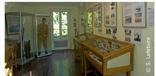
Le Musée de la Mémoire de Belleau

Herter rend hommage à son fils, Everit, tué à Belleau dans les derniers mois de la guerre. Il est représenté au centre de la toile, brandissant un fusil dont le canon arbore un bouquet de fleurs ! Il est enterré dans le cimetière américain Aisne-Marne, plot A, allée 13, tombe 59.