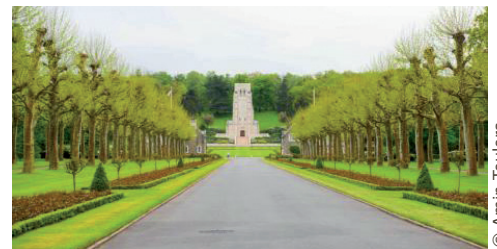
Le cimetière américain

Renseignements : tél. 03 23 70 70 90 email : aisne-marne@abmc.gov