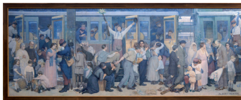
Le départ des Poilus, août 1914, par Albert Herter