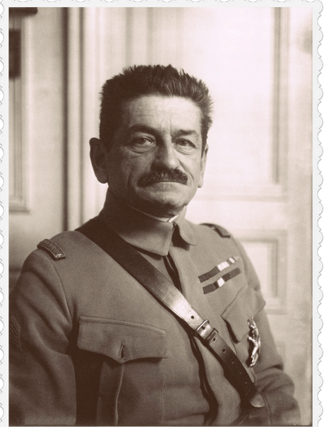
Portrait du général Mangin, aux commandes de l'offensive de juillet 1918

Le 18 juillet, sous le commandement des généraux Degoutte et Mangin, les alliés lancent une grande contre-offensive qui surprend les Allemands. Des milliers de soldats mettent en déroute l'armée allemande, qui ne cessera de reculer jusqu'à la signature de l'Armistice.