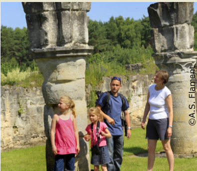
Balade sur le parcours à Bouconville-Vauclair