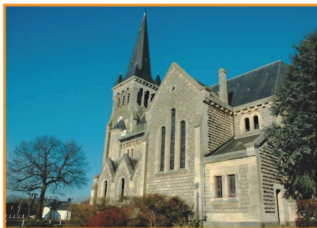
Église de Bichancourt.

D e la place de la Mairie de Bichancourt. Suivre à droite la rue de l'Église (cabine téléphonique, banc, panneau touristique des Verts Monts). Laisser le premier carrefour et poursuivre tout droit (direction Saint-Paul-aux-Bois). 1 Virer à gauche rue de la Censé. Laisser la rue Blanche à gauche et poursuivre tout droit dans le chemin en herbe qui passe derrière les maisons (vue sur la plaine à droite). 2 Virer à gauche dans la rue du Rond d'Arbres, puis à hauteur du calvaire, poursuivre tout droit dans la rue des Sources qui devient un chemin enherbé. Passer un bosquet et laisser le chemin à gauche pour continuer tout droit (vue sur les environs). 3 Virer à gauche pour descendre dans la vallée. Longer une rangée d'arbres et parvenir à Marizelle. Virer à gauche en bas du chemin pour prendre la petite rue goudronnée et suivre le virage à droite pour rejoindre la rue principale. 4 Continuer à droite jusqu'à la sortie de Marizelle. 5 Après le panneau de sortie, traverser la route et prendre en face le chemin. À la fourche, poursuivre tout droit. 6 Virer à gauche dans le chemin rural, poursuivre tout droit et longer un bois. 7 Après le bois, à la fourche, virer à gauche sur un chemin de terre (à gauche : zone marécageuse, à droite, digue en pierre). Continuer tout droit et passer un petit pont. Le chemin se transforme peu à peu en chemin goudronné (rue du Lavoir) et rejoint la rue principale de Mari-