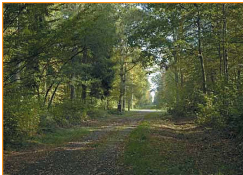
Forêt de Samoussy. -Stephan Lefèbvre-