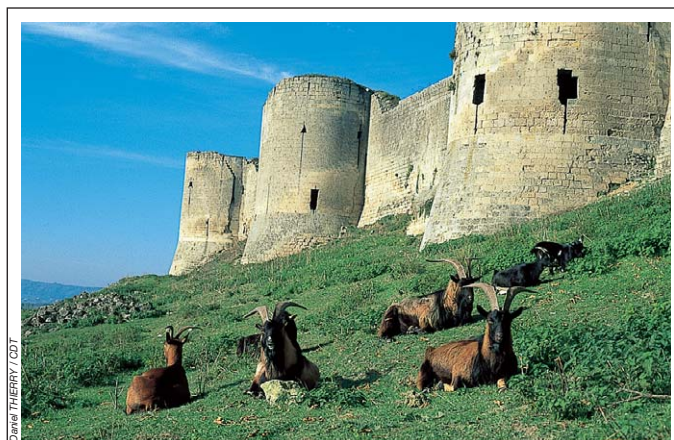
La forteresse de Coucy-le-Château.

Danger : traversée de route en 8, en 10 et en 19.