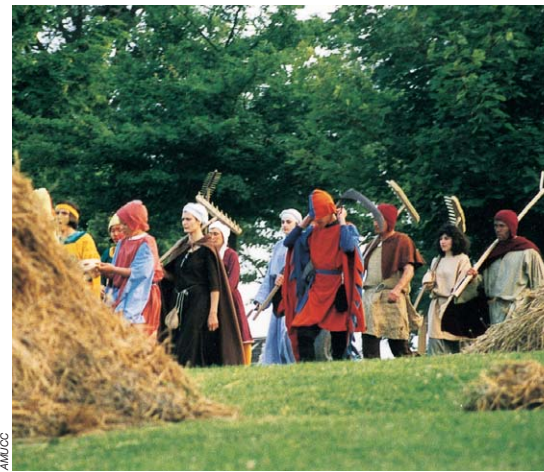
Spectacle estival « Coucy à la merveille ».

et le Mont-Saint-Michel, dans leur défaite, n'en fassent exploser une part importante, dont le fameux donjon, le 27 mars 1917. Dans la tour-musée de Coucy, on peut voir des maquettes et divers documents qui témoignent de ce qu'était le château avant cette date.