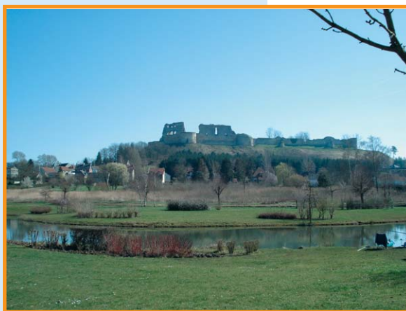
Vue de Coucy-le-Château. -Michel Lefèvre-