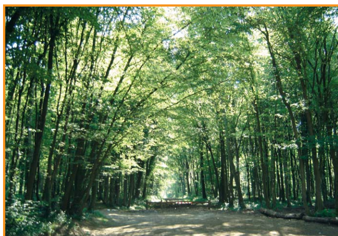
Forêt d'Andigny. -Syndicat Mixte Pays de Thiérache-

D Du parking situé le long de la route forestière des Blancs Fossés (route de Mennevret à La Vallée-Mulâtre), se diriger vers le panneau général présentant le circuit. Continuer dans la large allée qui s'ouvre droit devant (laie de Ronde Fosse). 1 Au niveau du panonceau « Le frêne », bifurquer à gauche. 2 Au carrefour de la laie