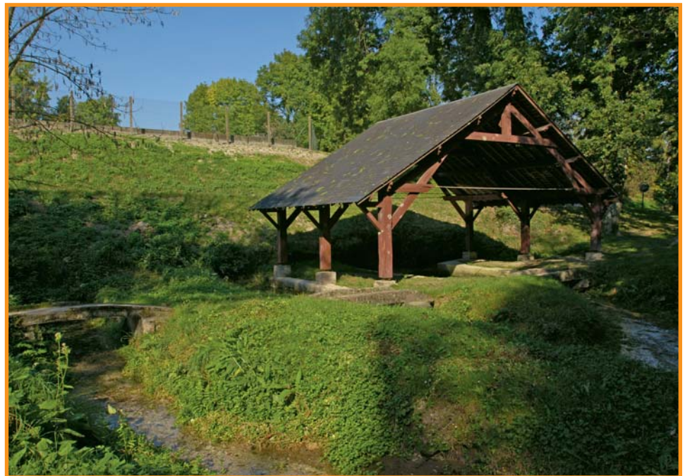
Lavoir à Vermand. -S. Lefebvre-

D Du centre culturel « Le Moulin » (musée) à Vermand. Se diriger vers Marteville. Traverser la D 73, puis une petite route. Continuer tout droit et s'engager sur un chemin de terre. Longer le bois. 1 Tourner à droite sur le chemin (vue sur Attilly). 2 À l'intersection, s'engager à droite.