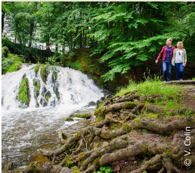
Aux abords de la cascade