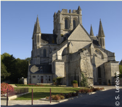
L'église Saint-Yved à Braine