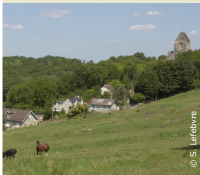
Paysage de Cutry