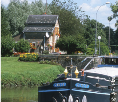
Maison éclésièrre au bord du canal