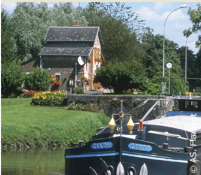
Maison éclésièr au bord du canal