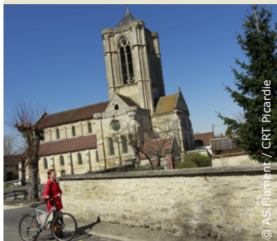
Petite pause à Vorges