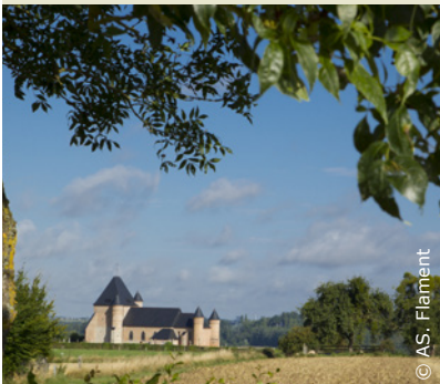
L'église fortifiée de Beaurain