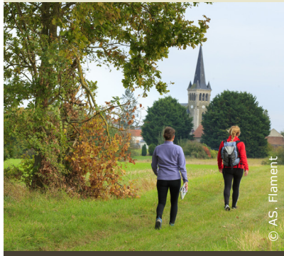
En chemin aux abords de Bichancourt