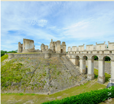
Vestiges du château de Fère