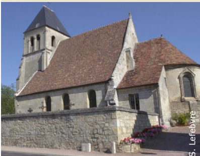
Eglise de Berny-Rivière