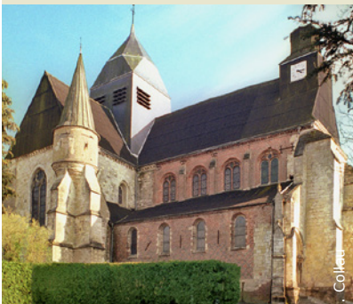
L'ancienne collégiale Saint-Laurent

INFOS TOURISTIQUES : Office de tourisme du Pays de Thiérache Tél. : 03 23 91 30 10