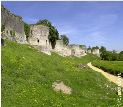
Les remparts du château de Coucy