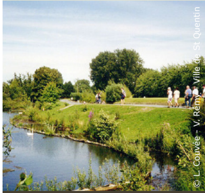
Le Parc d'Isle