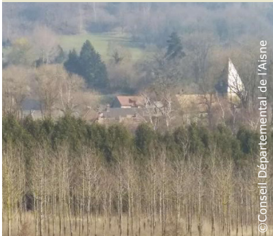
Peupleraie au sortir du village de Saint-Thomas