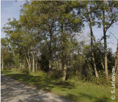
Le marais Saint-Boétien

INFOS TOURISTIQUES : Office de Tourisme du Pays de Laon Tél. : 03 23 20 28 62