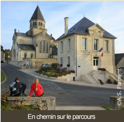
En chemin sur le parcours