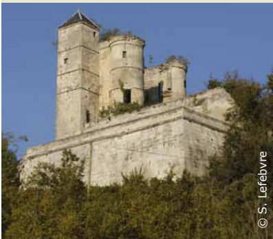
Château de Pernant