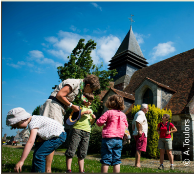
La vieille église de Caumont