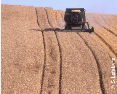
Un vaste plateau cultivé