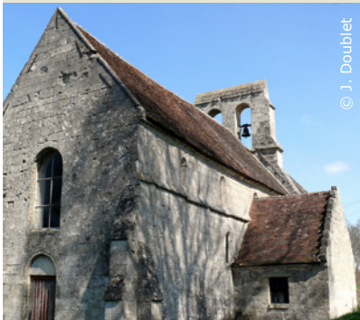
Eglise Saint-Pierre de Barbonval