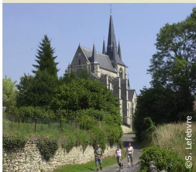
Aux abords de l'église de Royaucourt