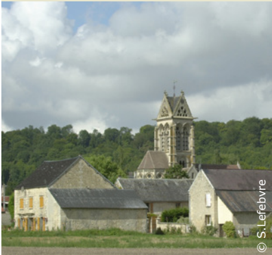
En chemin, le village de Vasseny