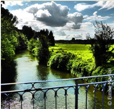
Une promenade agréable au bord de l'Oise