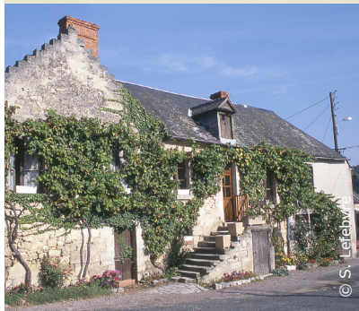
Vendangeoir à Vorges