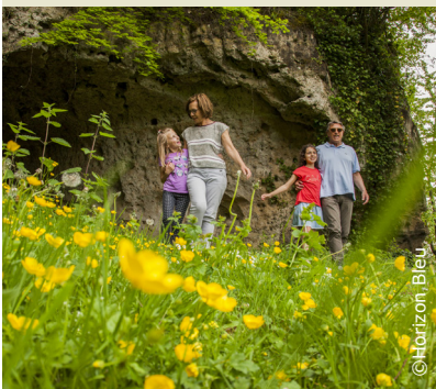
Les creuttes de Paissy

INFOS TOURISTIQUES : Office de Tourisme du Pays de Laon Tél. 03 23 20 28 62