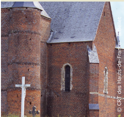
L'église Saint-Martin de Burelles