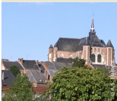
L'église fortifiée de Montcornet