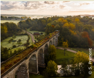
Le viaduc d'Ohis