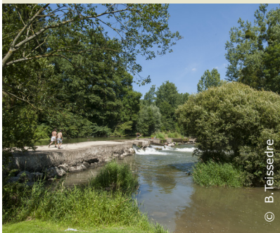
Pause fraîcheur à la rayère d'Alaincourt