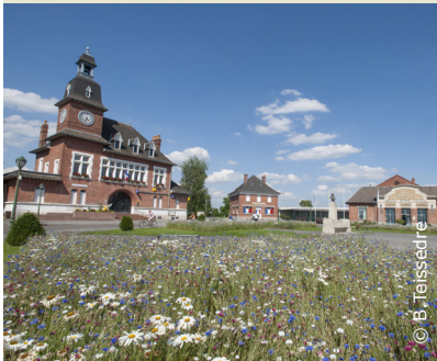
La place Carnegie, bel ensemble urbain