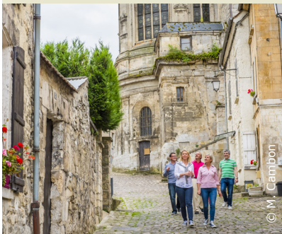
Dans les ruelles de La Ferté-Milon