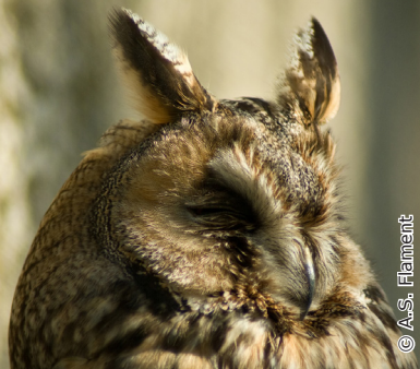
Hibou moyen duc