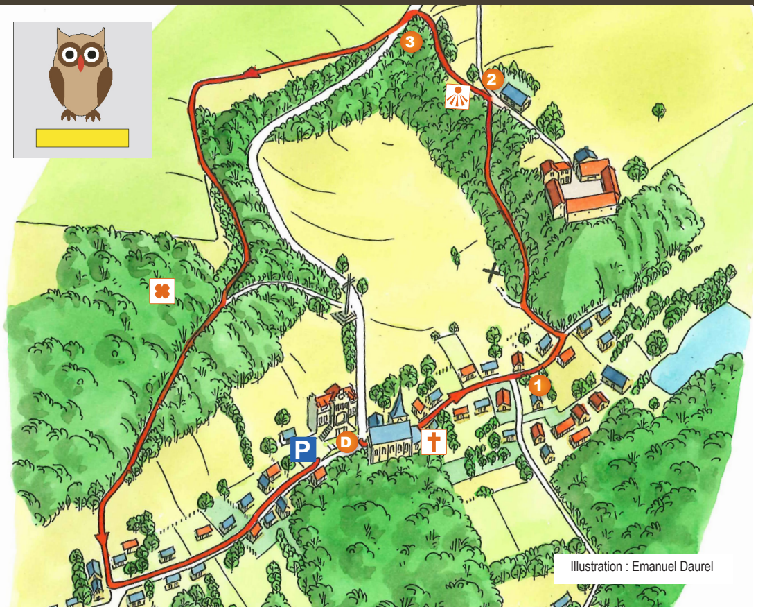
Illustration : Emanuel Daurel